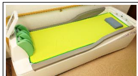
ウォーターベッド